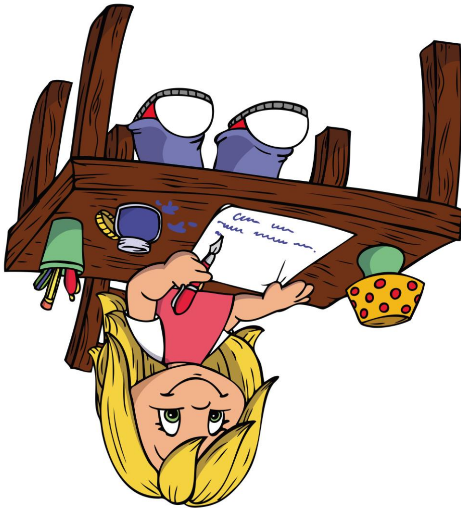
Abb.: © Christine Wulf – fotolia