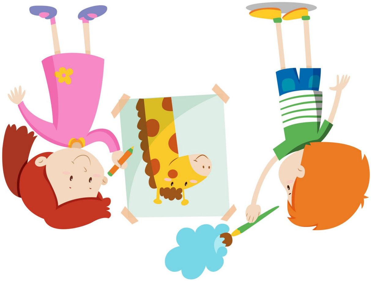
Abb.: © bluringmedia – fotolia