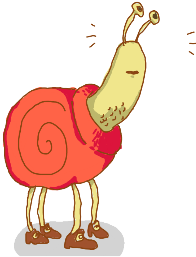
Abb.: © fishhead- CC BY 2.0