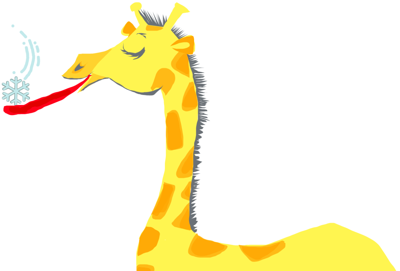
Abb.: © Joe H.F. - CC BY 2.0