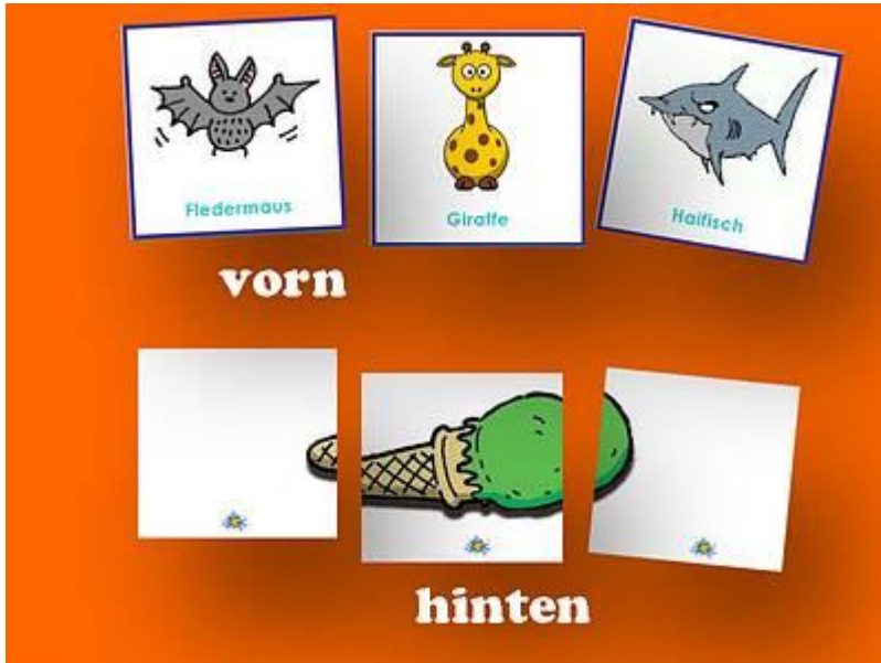
Bild / Buchstaben- Zuordnungsmaterial mit allen 26 Buchstaben des Alphabets:

Die Abbildungen entsprechen Wörtern aus den Grundwortschätzen der Klasse 1 und 2.