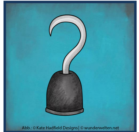
Abb.: © Kate Hadfield Designs | © wunderwelten.net

Der Anker hält das Schiff an seinem Ankerplatz fest.