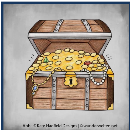
Abb.: © Kate Hadfield Designs | © wunderwelten.net

Schaut man durch ein Fernrohr, erscheinen entfernte Dinge größer und näher.