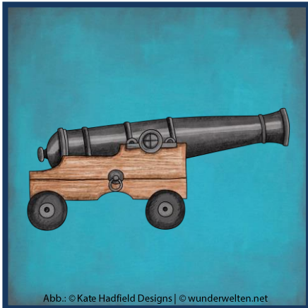
Abb.: © Kate Hadfield Designs | © wunderwelten.net

Mit der Kanone schießen die Piraten auf ihre Feinde.