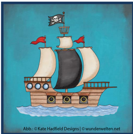
Abb.: © Kate Hadfield Designs | © wunderwelten.net

Pirat Malte fehlt eine Hand. Er hat dafür eine Hakenhand.