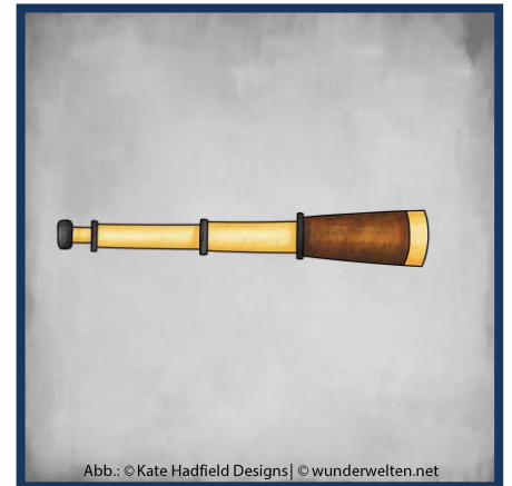
Abb.: © Kate Hadfield Designs | © wunderwelten.net

Auf langen Reisen trinken Piraten oft Rum statt Wasser. Rum bleibt auch in der Hitze keimfrei.