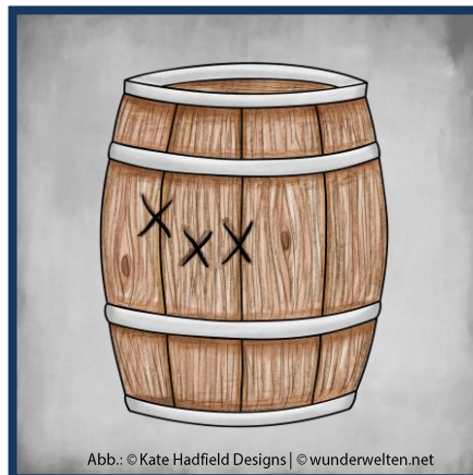
Abb.: © Kate Hadfield Designs | © wunderwelten.net