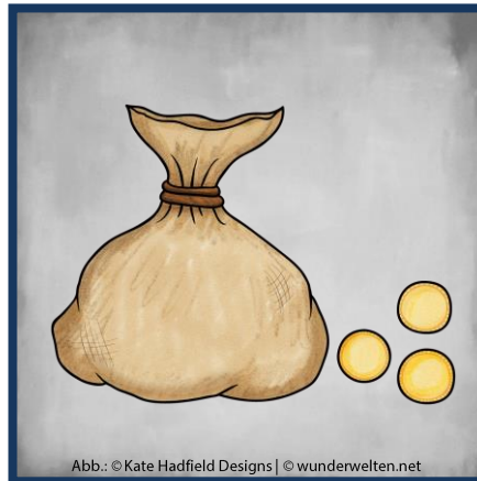
Abb.: © Kate Hadfield Designs | © wunderwelten.net