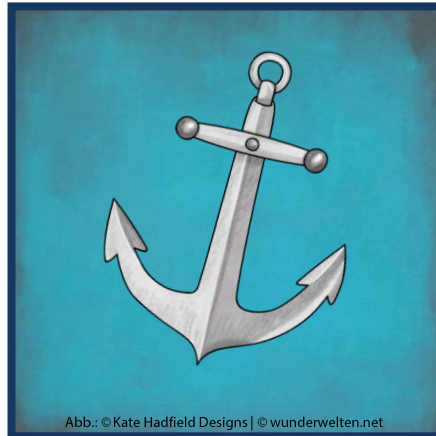
Abb.: © Kate Hadfield Designs | © wunderwelten.net

Mit der Kanone schießen die Piraten auf ihre Feinde.